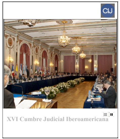
XVI Cumbre Judicial Iberoamericana