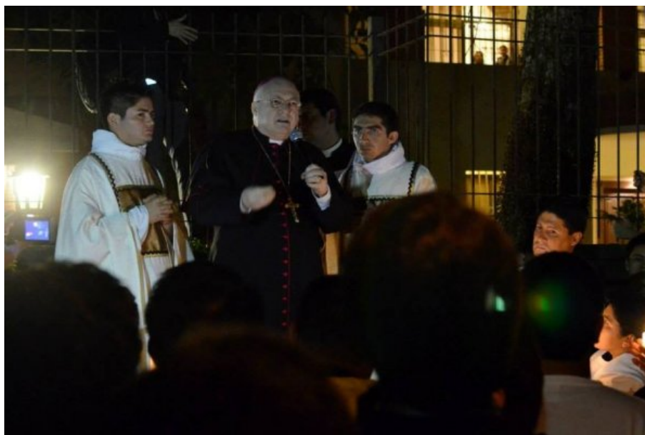
Rogelio Livieres, obispo de Ciudad del Este.

[VIDEO] Monseñor Rogelio Livieres, obispo de Ciudad del Este, nuevamente defendió al cura argentino Carlos Urrutigoity, denunciado por abuso sexual y pedofilia. Dijo que el religioso es simplemente "perseguido" por los familiares de los afectados.