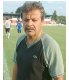
Copa Argentina: Gimnasia partió a Chaco con la formación confirmada